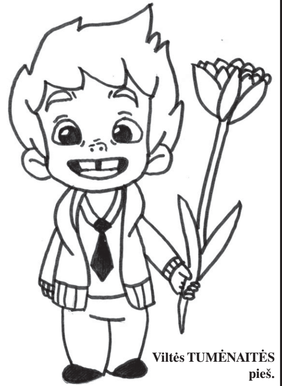
Viltės TUMĖNAITĖS pieš.